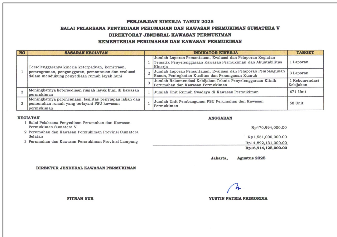
Gambar 2.3 Perjanjian Kinerja BP3KP Sumatera V dengan Direktorat Jenderal Kawasan Permukiman