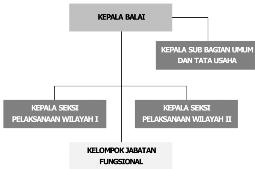
Gambar 1.1 Struktur dan Organisasi BP3KP Sumatera V

Struktur organisasi di Balai Pelaksana Penyediaan Perumahan dan Kawasan Permukiman Sumatera V menurut Peraturan Menteri Perumahan dan Kawasan Permukiman Nomor 1 Tahun 2025 tentang Organisasi dan Tata Kerja Unit Pelaksana Teknis di Kementerian Perumahan dan Kawasan Permukiman dapat digambarkan sebagai berikut: