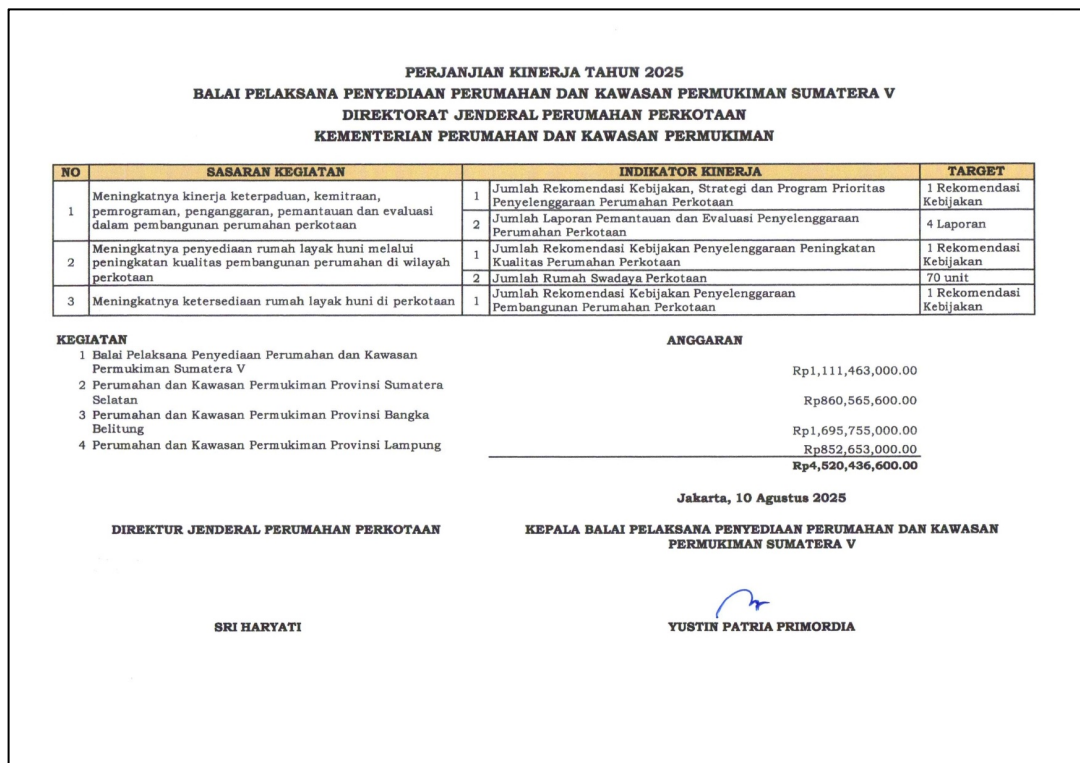
Gambar 2.5 Perjanjian Kinerja BP3KP Sumatera V dengan Direktorat Jenderal Perumahan Perkotaan