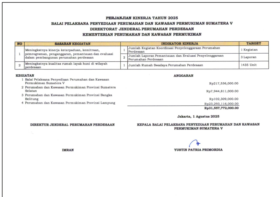
Gambar 2.4 Perjanjian Kinerja BP3KP Sumatera V dengan Direktorat Jenderal Perumahan Perdesaan