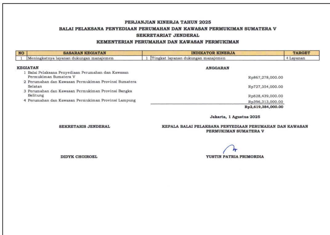
Gambar 2.7 Perjanjian Kinerja BP3KP Sumatera V dengan Sekretariat Jenderal