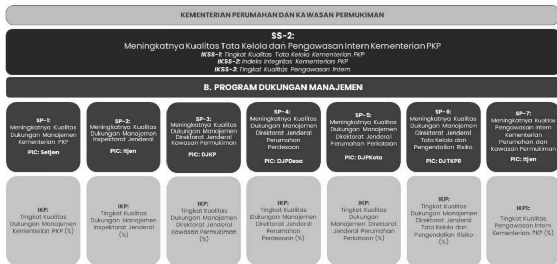
Gambar 2.2 Sasaran Strategis 2 Kementerian PKP

Dan sebagai dukungan dalam pelaksanaan penyelenggaraan perumahan dan kawasan permukiman, berdasarkan Rencana Strategis Tahun 2025-2029, Balai Pelaksana Penyediaan Perumahan dan Kawasan Permukiman Sumatera V melaksanakan sasaran program yang merupakan penjabaran dari sasaran strategis.